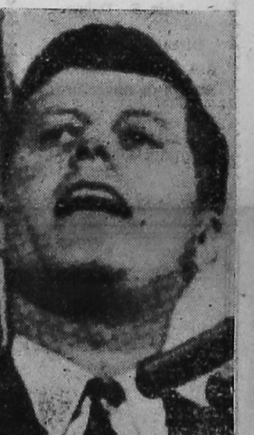
KENNEDY O Presidente estadunidense recebeu cordialmente o Chefe da Nação Brasileira.

O "Post Dispatch", influente jornal do médio oeste dos Estados Unidos, fundado por Joseph Pulitzer, afirma, em sua editorial, que seria inadmissível que o Estados Unidos não levassem em conta o Brasil. Considera esse órgão que a visita do Presidente Goulart deve concentrar a opinião norte-americana "neste gigante do Sul". Assinala, entretanto, que, para o nivelamento definitivo dos enormes contrastes entre privilegiados e desesperados, o Brasil precisa adotar um sistema tributário mais progressista, além das medidas antinflacionárias que já tomou.