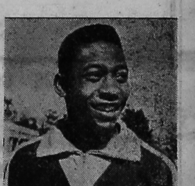
PELÉ , o maior jogador do mundo, está sendo a "vedete" do "screetch" nacional.