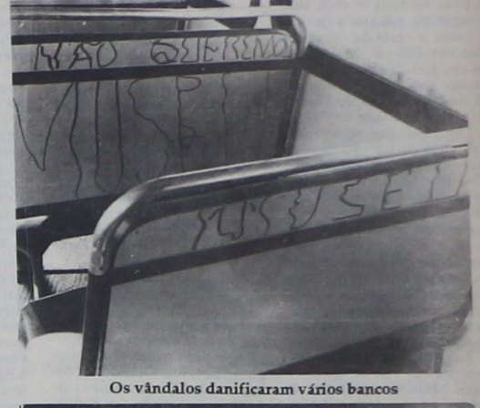
Os vândalos danificaram vários bancos

Acredita-se que o autor ou autores do ato de vandalismo sejam identificados e denunciados, pelos estudantes que realmente estão buscando educação, a nível de segundo e terceiro grau, em Curitiba.