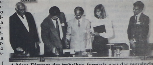
A Mesa-Diretora dos trabalhos, formada para dar sequência aos assuntos em pauta para os debates

Entre os objetivos do I Congresso, estava a promoção do conagração dos filatelistas e simpatizantes, o debate em torno do desenvolvimento da Filatelia no Estado do Paraná e a discussão para a evolução cultural da