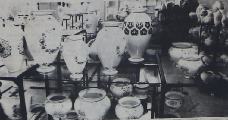
Campo Largo consolida o seu título de Capital da Louça