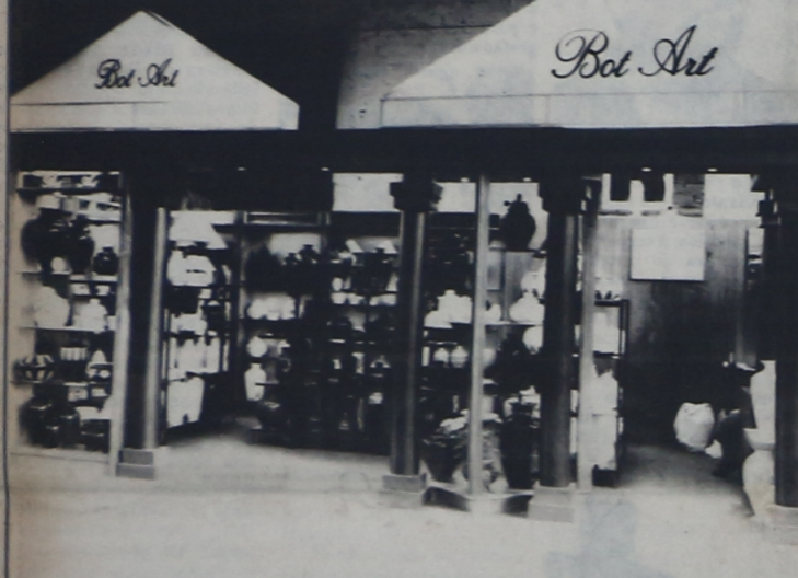
A indústria e o comércio de Campo Largo apostam alto na Feira

Rainha da Cerâmica — A Rainha da Cerâmica, Eli-