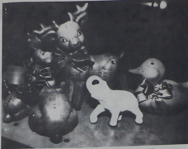
Peças de grande originalidade, atraem a atenção do público

Espaço — A imagem de Campo Largo como Capital Nacional da Louça vem se consolidando, com a realização das Feiras. É opinião geral de expositores e visitantes que no próximo ano deverá haver um maior espaço, até para que mais empresas possam participar, além de mais publicidade, para que um maior número de pessoas