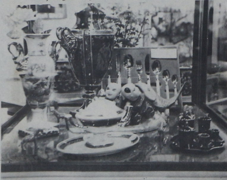
Os expositores capricharam na decoração dos estandes