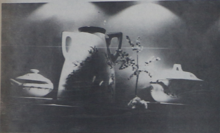
O traço fino e a beleza dos produtos, são atração principal da Feira