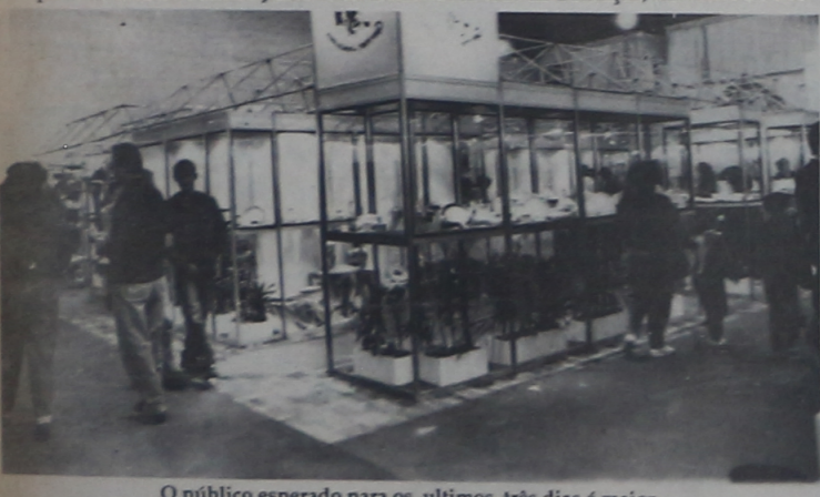
O público esperado para os últimos três dias é maior