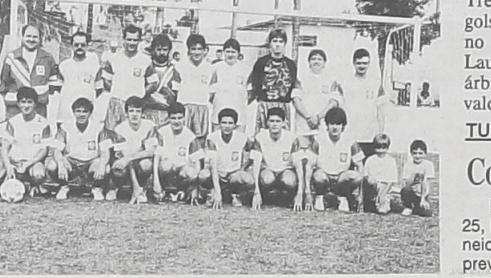
Janiski que está fazendo uma campanha das melhores no Campeonato de Futebol Suíço.

Após cumprida a 2ª rodada do Campeonato de Futebol Suíço, promovido por Andrade Vieira e Amorim Promoções, com o apoio de Bebidas Metropolitana, as equipes do Dalzoto e Janiski conquistaram quatro pontos em duas rodadas e com o pessoal dando um show de organização e atendimento nas rodadas que são realizadas na sua cancha. Os resultados da 2ª rodada foram: Quappas 1x0 Cocel, Comercial Rondoninha 1x0 Caracol, Bar Ice Beer 2x1 Italiano Automóveis, Dalzoto 2x0 Barretos, Turma da Rural 2x0 Barracão, Caixa Econômica Federal 1x1 Brasília, Refinações 3x0 Itambé, Germier 1x0 Restaurante Patrício, Transpolti 2x0 Pilarbrax, Recapadora Bossani 0x0 Studio Ivonete, Janiski 3x0 Casa Aurora Colchete, Mecânica Casa Aurora Lovheis, Mecânica Casa Aurora 2x0 Merceária Aldi, Bar