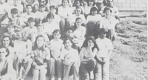
Os alunos da Escola Mauro Portugal - CAIC que representaram muito bem Campo Largo XXXIX Jogos Estudantis da Primavera

De 16 a 24 de setembro passado, realizou-se na cidade de Ponta Grossa a 39ª edição dos Jogos Estudantis da Primavera. Campo Largo fez-se representar pela Escola Municipal Mauro Portugal do CAIC, que dentro do subprograma de Esportes, manteve as escolinhas de treinamento de Atletismo, Handebol, Voleibol, Futsal e Tênis de Mesa.