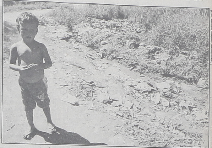
As crianças convivem com o lixo e esgoto a céu aberto no Jardim Meliane

O Jardim Meliane é um conjunto de moradias, das quais os terrenos foram doados pela Prefeitura de Campo Largo. Após ter sido desapropriado, o terreno foi dividido entre pessoas pobres e carentes. Isto foi realizado em época de eleição. Devem ter recebido muita demagogia e muitos votos. Depois destes anos o lugar foi completamente abandonado pelas autoridades. Pontes caídas não são reconstruídas, não existe iluminação e a sujeira está fazendo crianças adoecerem. O caminhão de lixo nunca passou por aquele local.