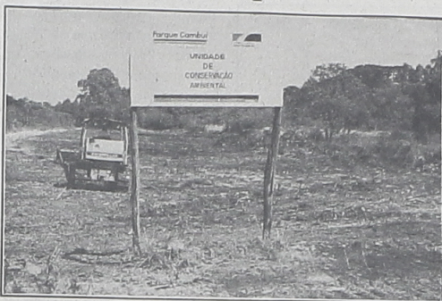
Máquinas fazendo limpeza do Parque Ecológico do Cambuí

Durante os dias 7, 8 e 9 de abril, todo o Parque Ecológico do Cambuí foi limpo. Após denúncias de moradores e matérias do jornal "O Metropolitano", as máquinas da Prefeitura de Campo Largo limpam todo o local. A rapidez e empenho na limpeza provam que certas Secretarias Municipais estão ligadas e funcionando muito bem. Que sirva de exemplo para outras que estão "criando teias".